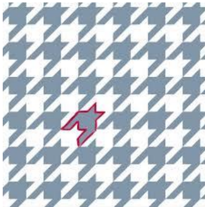
Cuadrícula con modulo positivo y negativo