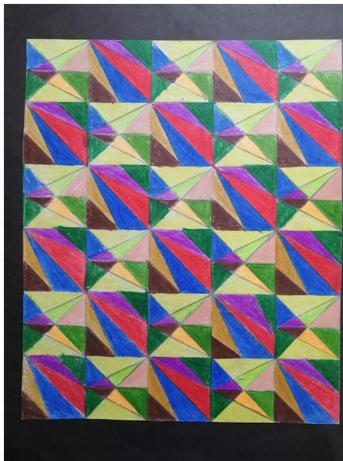
Dibujo mostrado en clases (dos modulos)