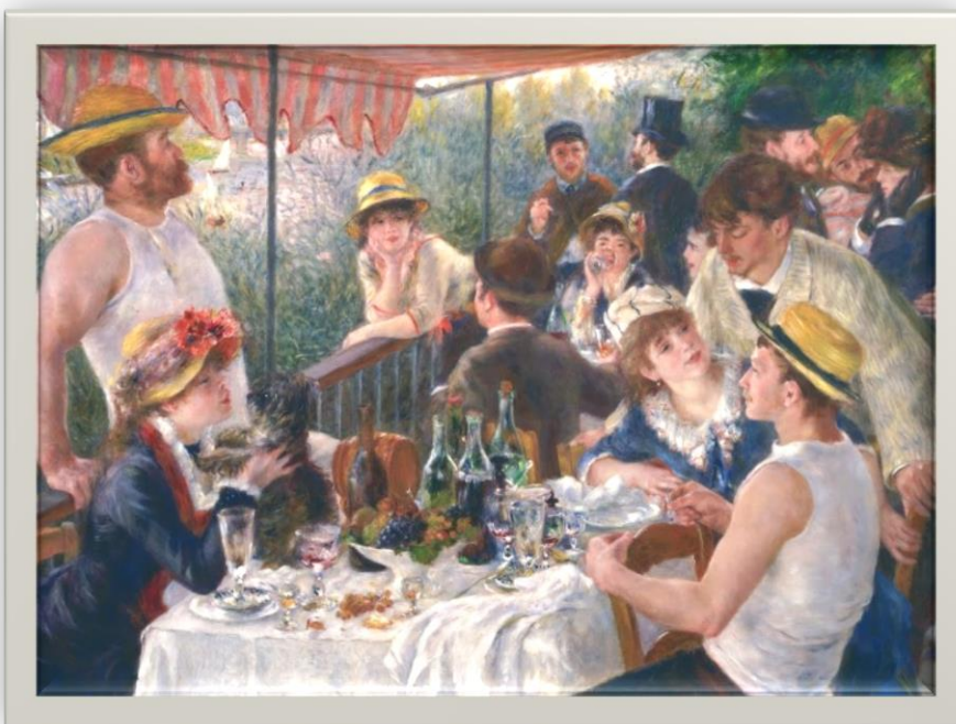
"Luncheon of the Boating Party" Pierre-Auguste Renoir 1880 – 1881