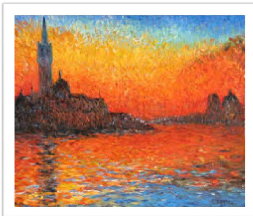
Claude Monet "Sunset in Venice"