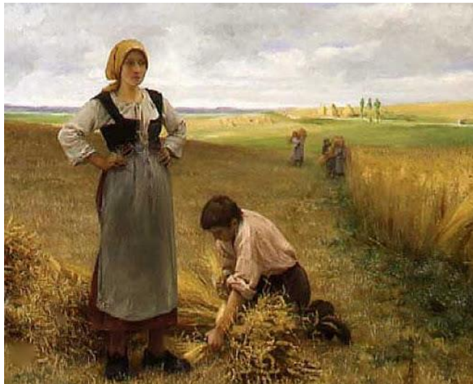
Pintura de Georges Luce (Estilo Realista)

En la pintura realista e hiperrealistas los contornos también son muy sutiles, pues se dice que el contorno no existe en la naturaleza o realidad.