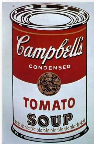
Andy Warhol, lata de sopa Campbell

Sin embargo, entre los representantes de este movimiento, también destacan artistas como Richard Hamilton, creador del collage ¿Qué es lo que hace de los hogares de hoy en día tan diferentes, tan divertidos?; Roy Lichtenstein, autor de Good Morning, Darling, o Tom Wesselmann, creador de la serie Gran desnudo americano.